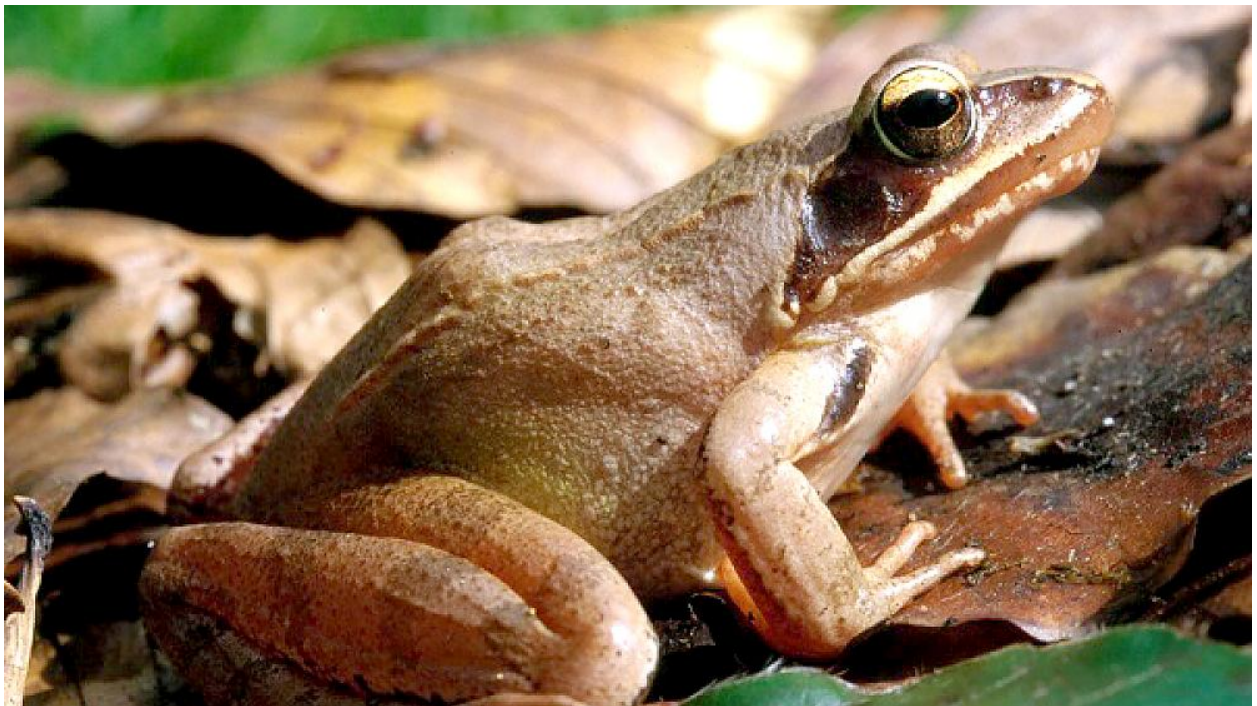
Springfrosch (Rana dalmatina)

Acht Jahre nach Eröffnung der Landebahn Nordwest: Wie hat sich die Populationen der Amphibien am Beispiel des Springfrosches nach seinem Umzug weiterentwickelt?