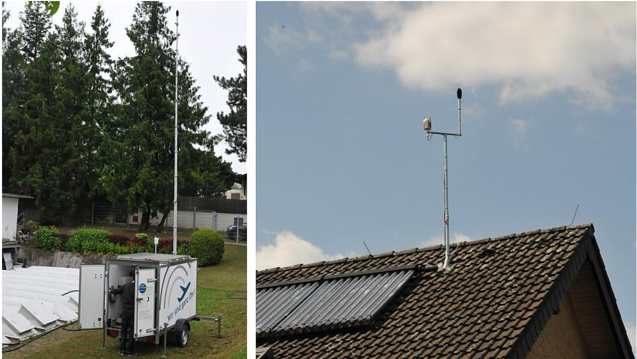
Zwei mobile und neun fest installierte Messstationen erfassen den Fluglärm